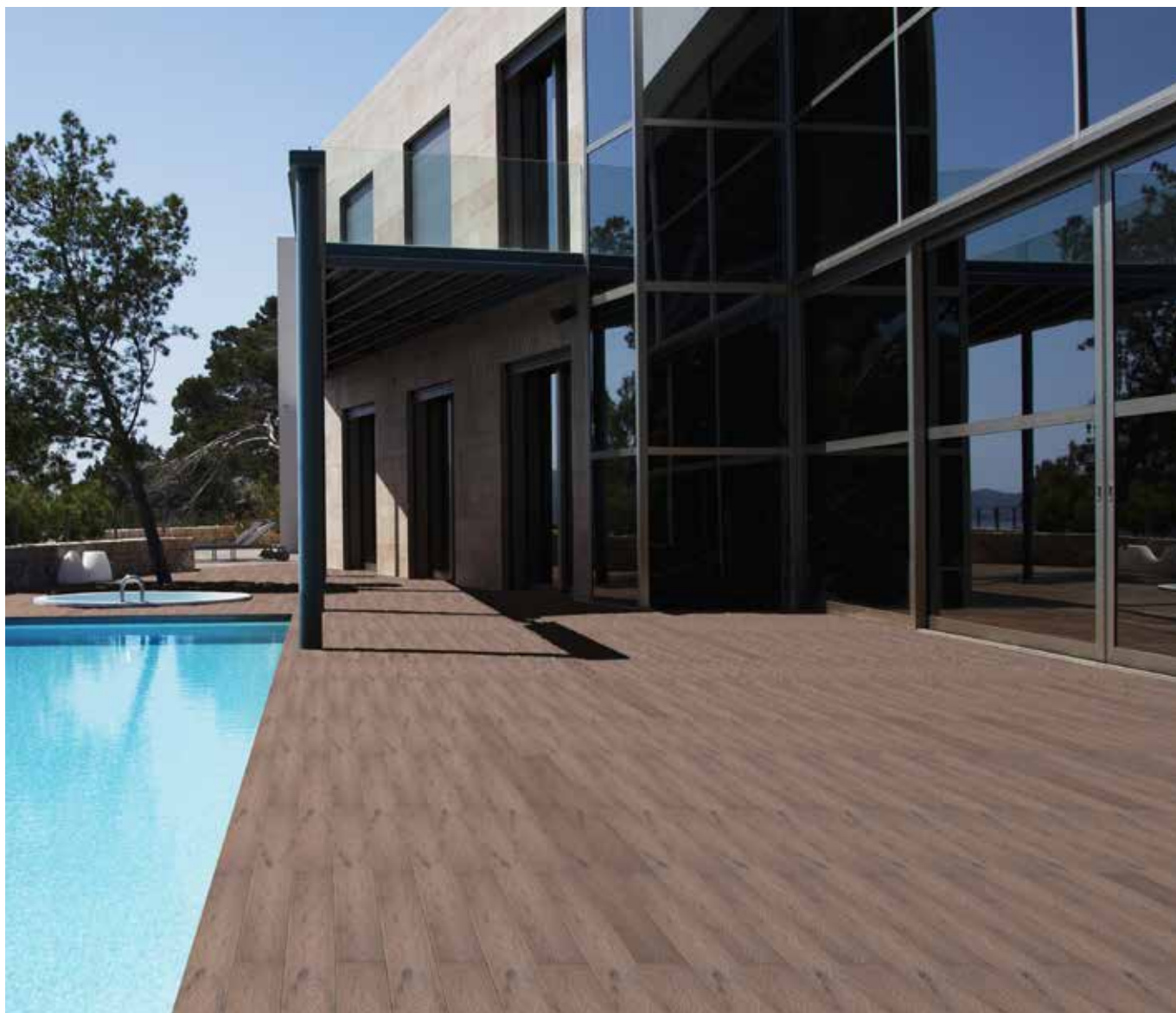
GARDIN NATUR - Teak