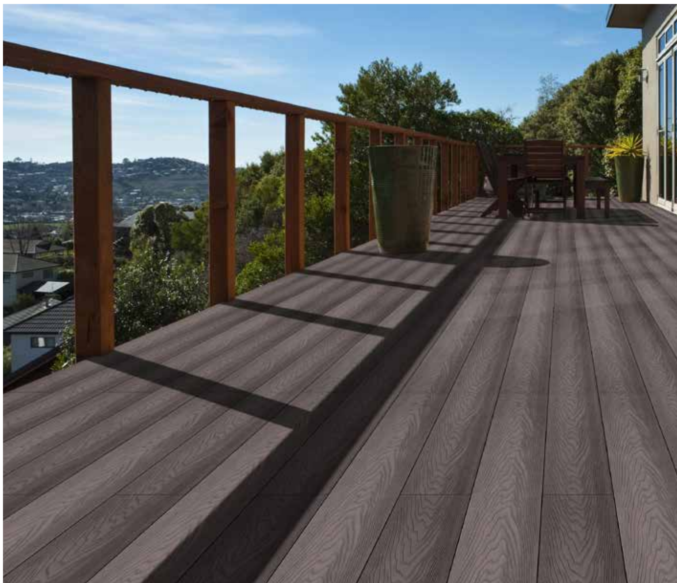
GARDIN NATUR - Ořech Antik