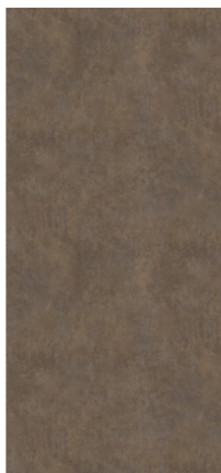
Náhľad na celú dosku