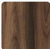
32339 AN Orech Tortona Povrchová štruktúra Authentic