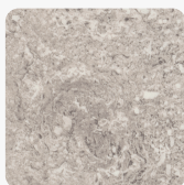
F052 ST75 Travertin Calais Povrchová štruktúra Mineral Satin