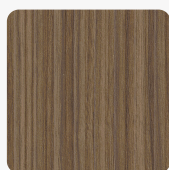
Riga LS54 RI Povrchová štruktúra Riga