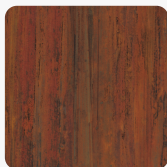
0798 NT Tambora