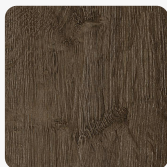
0909 NT Brown Flagship Oak