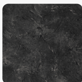
3953 PE Bridlica čierna Povrchová štruktúra Perlička