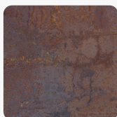
K4398 DP Rusty Iron Povrchová štruktúra Štuk