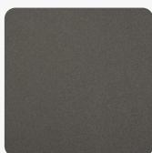
FB82 ID Idea Tellurio Povrchová štruktúra Idea