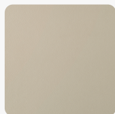
UA80 PF Primofiore Corda Povrchová štruktúra Primofiore